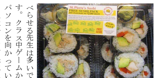
St. Pierre's Sushi FREE SUSHI PACK

な。私の学校は女子高で、人口が2400人。その2400人から30%は中国人です。学校で英語より中国語を聞くときは多いです。ニュージーランドの学校の勉強はとっても簡単です。先生が高校は